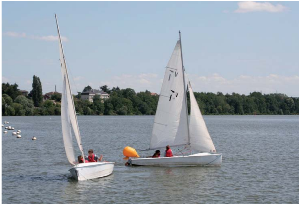
L'animation estivale au club de voile de Metz-Olgy