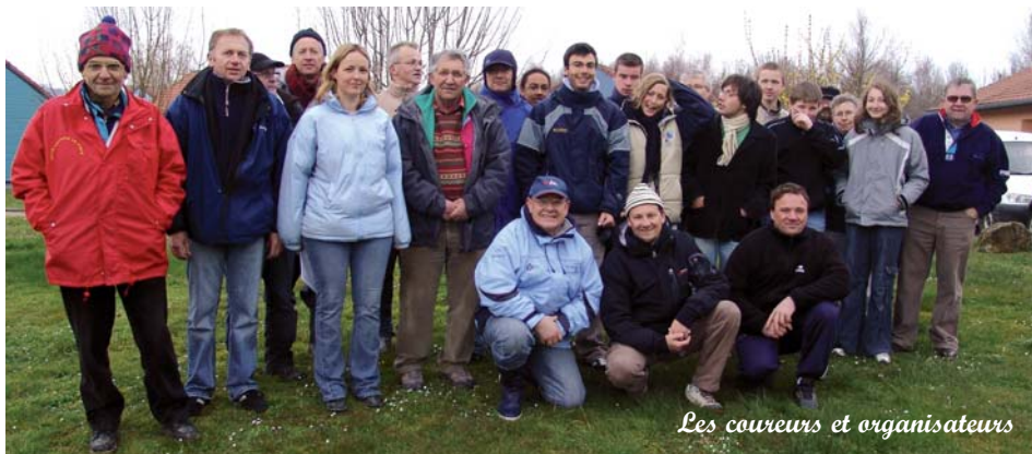
Les coureurs et organisateurs

Le club nautique lorrain a organisé à Madine la première sélective interligue de la classe Europe pour la saison 2007. Elle a rassemblé moins de participants que prévus, les Parisiens et nordistes n'étant pas venus car l'inter ligue de l'ouest a été déplacée à Paris. Les concurrents venaient d'Alsace, Lorraine, Champagne Ardennes et Bourgogne. Un panier de chocolat de Pâques les attendait à l'inscription.