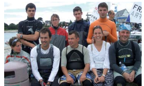
L'Alsace et la Lorraine

Vendredi le soleil a repris le dessus et nous courrons trois manches avec un vent de