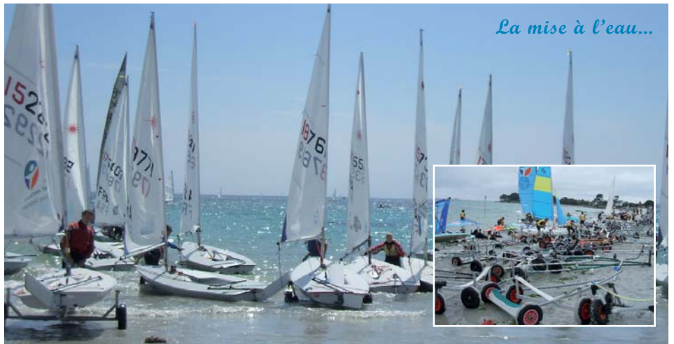
La mise à l'eau...

En rentrant on apprend, par hasard, qu'il y a une jauge cet après-midi même. (Ah oui j'ai oublié de dire que durant cette régates il a fallu être au bon moment au bon endroit). Une grande tente est installée près de la plage et on suppose donc que la jauge sera par là, bientôt, sûrement ! Mon frère et moi restons à proximité en compagnie des tahitiens. Heureusement car le jaugeur arrive soudain et grâce à notre "attente de proximité" en dix minutes les voiles sont jaugées et nous sommes inscrits.